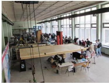
Лабораторията по метални конструкции