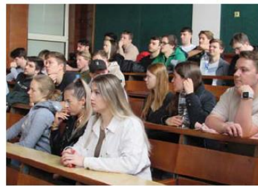
По време на лекцията по сеизмично инженерство

където германските студенти проявиха голям интерес. Стана ясно, че в нея се провеждат лабораторни занятия по обособяване и изпитване на строителни съоръжения, изучават се основи на строителното дело. Освен практическата учебна дейност в лабораторията се извършват експериментал-