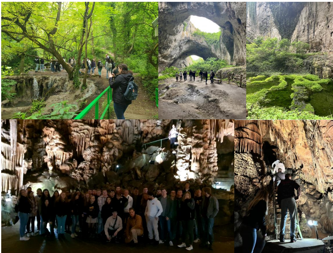
Krushunski-Wasserfälle (oben links)- Devetashka-Höhle (oben, mitte und rechts) - Saeva Dupka (Bilder unten)

Der erste Tag der Exkursion begann mit der Erkundung des Balkengebirges (Stara Planina) und der Erforschung von zwei dort befindlichen Höhlen. In der Region befinden sich die Krushunski-Wasserfälle, welche in dieser Jahreszeit äußerst sehenswert sind. Die Devetashka-Höhle ist eine der Größten im Land und ist ein Naturphänomen mit großen Öffnungen in der Decke und fließenden Bächen, dank derer die Höhle mit üppiger Vegetation bewachsen ist und ein Zuhause für 3.000 Fledermäuse bietet. Daher ist es nicht verwunderlich, dass die Höhle für die Dreharbeiten des Hollywoodfilms „Expendables 2“ als Kulisse gewählt wurde. In der zweiten Höhle „Saeva Dupka“ wurde der Unterschied zwischen einem Stalaktit, Stalagmit und Stalagnat anschaulich vermittelt. Der erste Tag war eine gute Gelegenheit zum Kennenlernen, da die Gruppe aus Studierenden zweier Studiengänge unterschiedlicher Semester zusammengesetzt war.