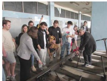
Лабораторията на катедра „Железници“

нение на строителството вече ще разполагат със специализирана геопросторствена информация. „Сеизмичният риск е нещо, което може да се управлява от хората и е важно за живота на всички“, коментира гостите.