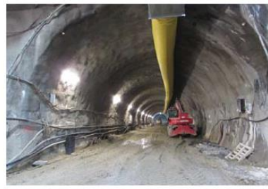
Тунелът на метрото